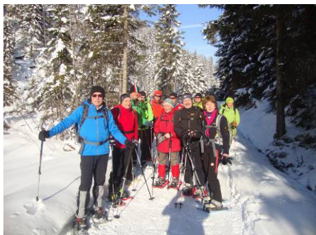
Von Rinnen (1262 m) ging es über den Forstweg zur Ehenbichler Alm