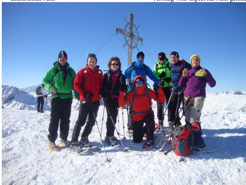
Sonnenschein, guter Schnee und eine genussvolle Einkehr auf der Ehenbichler Alm ließen alle schwärmen.