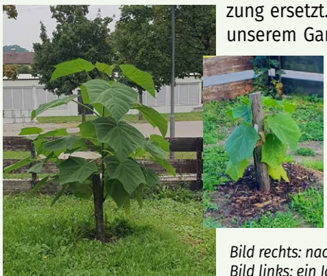
Bild rechts: nach Pflanzung im Jahr 2023 Bild links: ein Jahr später

eine Photovoltaikanlage mit 19,5 KWp für die Volleinspeicherung sowie eine Photovoltaikanlage mit 9,5 KWp und mit einem 7,7 KW Speicher für den Eigenverbrauch installiert. Seit 19.08.2024 bis Redaktionsschluss zum 06.10.2024 konnten somit 94% an Strombezug gespart werden. Im Saal wurden neue Fenster sowie eine neue winddichte Haustüre eingebaut. Des Weiteren wurde in Eigenleistung die komplette Fassade des Gebäudes neu gestrichen und farbliche Akzente gesetzt. Im Herbst 2023 wurde die alte Ölheizung durch eine neue CO2 neutrale Pelletheizung ersetzt. Unser Klimabaum in unserem Garten ist in einem Jahr um einen Meter gewachsen. Siehe Bild. Damit leistet unsere Sektion einen erheblichen Beitrag zur CO2 Reduzierung und CO2 Vermeidung.