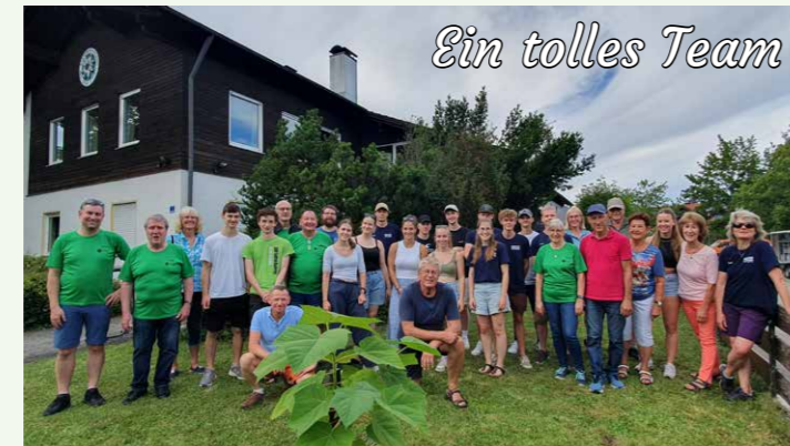
Ein tolles Team