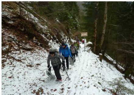
Zeitweise auch ohne Schneeschuhe auf leisen Sohlen über die Staatsgrenze....