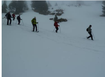
... und der Abstieg im Pulverschnee macht richtig Laune....