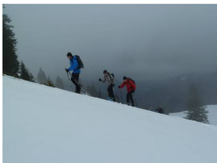
..und weiter hinauf in die Wolken