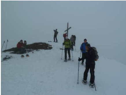
da fiel die Gipfelrast recht kurz aus....