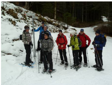
Los geht's am Grenzübergang Pfronten / Enge