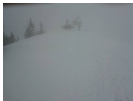
nur noch Schattengestalten am Gipfel