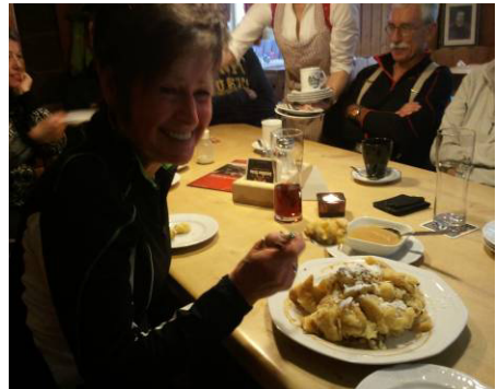
und dann der Kaiserschmarrn auf der Fallmühle ...mmhh