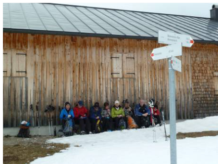
mit verdienter Rast an der Pfrontener Alpe