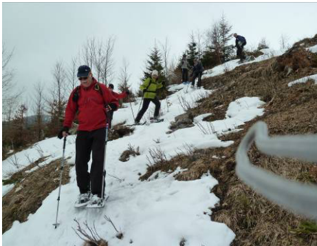
auf der Suche nach Schneeresten....